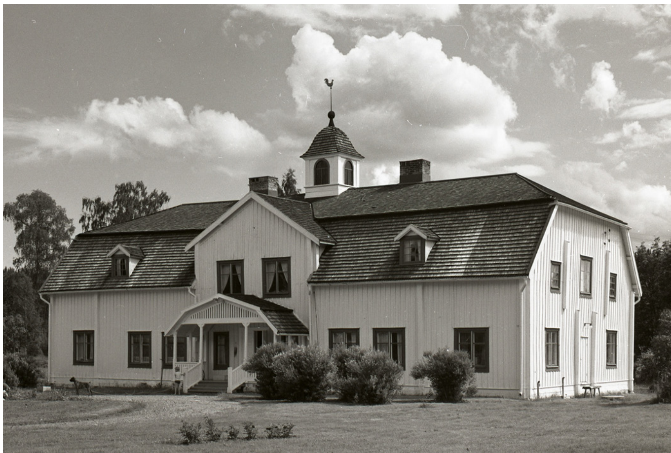
Brukssamhället i Västanå, där Rothoff spenderade sina första år, är helt borta. Det som återstår är en handfull gamla byggnader – däribland bruksherrgården från 1810, som uppfördes av hans farfar.